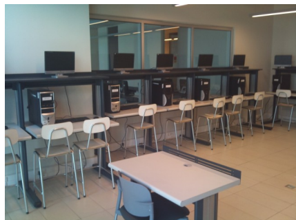
LABORATORIO LEICA UTC INACAP MAIPÚ